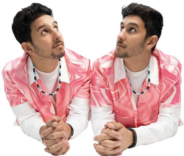
Les French Twins